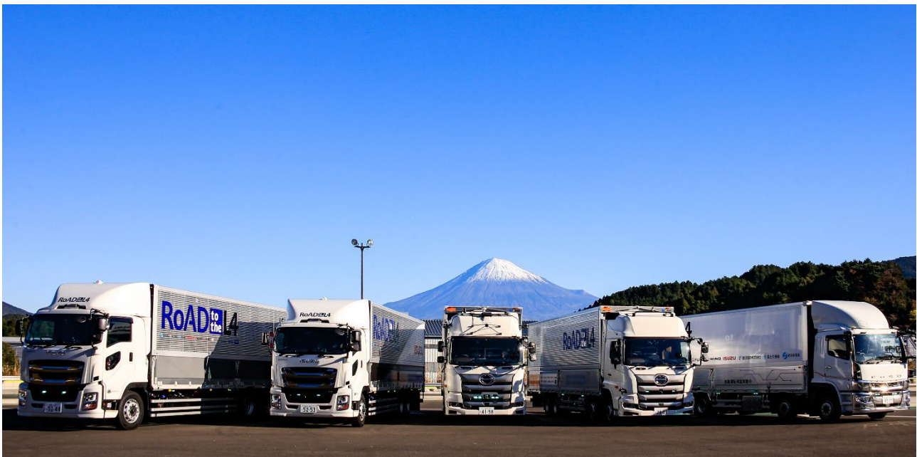
UDトラック、いすゞ、先進モビリティ、日野、三菱ふそうの自動運転実験車両

本日より、上記受託者4社と商用車メーカーのいすゞ自動車株式会社、日野自動車株式会社、三菱ふそうトラック・バス株式会社、UDトラック株式会社の4社は、テーマ3事業の最終年度にあたる取り組みとして、新東名高速道路において、これまでの検証・実証の集大成としての総合走行実証を開始しました。