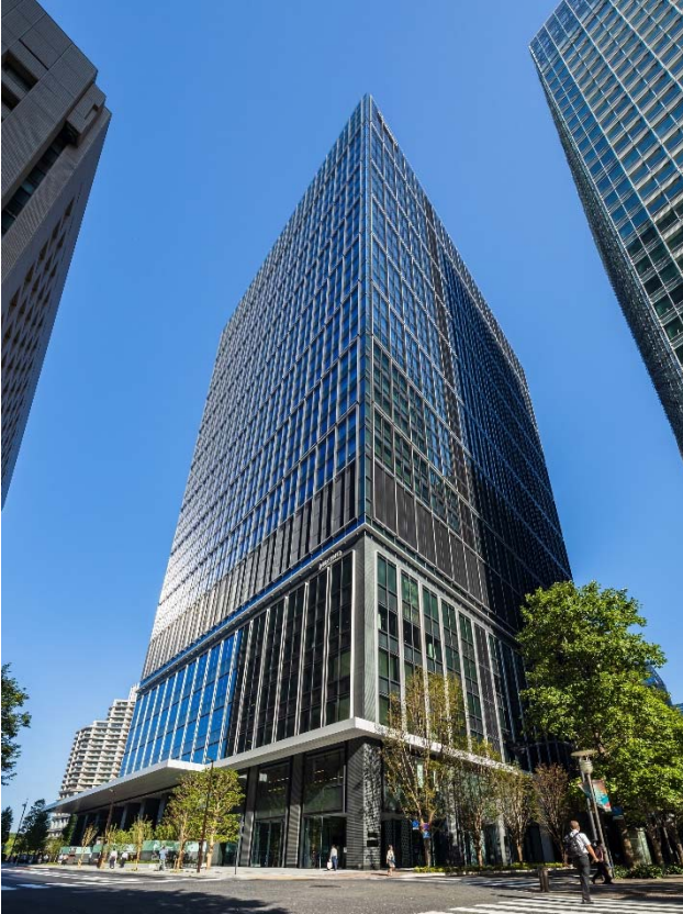
【みずほ丸の内タワー 外観】