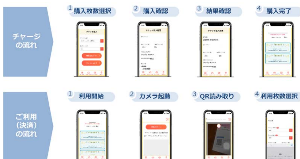
図 2 チャージとご利用の流れ

自治体等はあらかじめ販売額や、発行上限・プレミアム率などを設定できるほか、利用状況や精算情報を管理することが可能です。