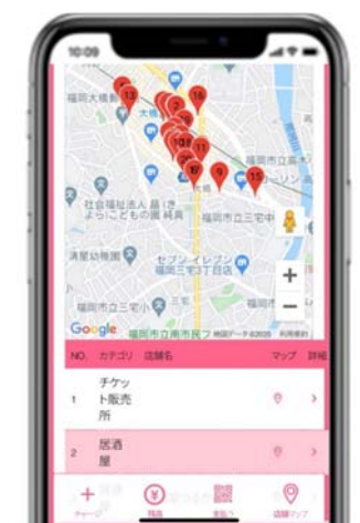
図 3 店舗情報ページ