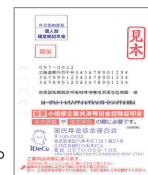
「小規模企業共済等掛金控除証明書」