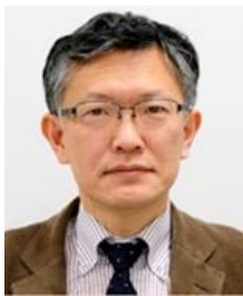
丸川 知雄 東京大学 社会科学研究所教授

1964 年生まれ 1987 年 東京大学経済学部卒業 1987～2001 年 アジア経済研究所勤務 2001 年～ 東京大学社会科学研究所勤務